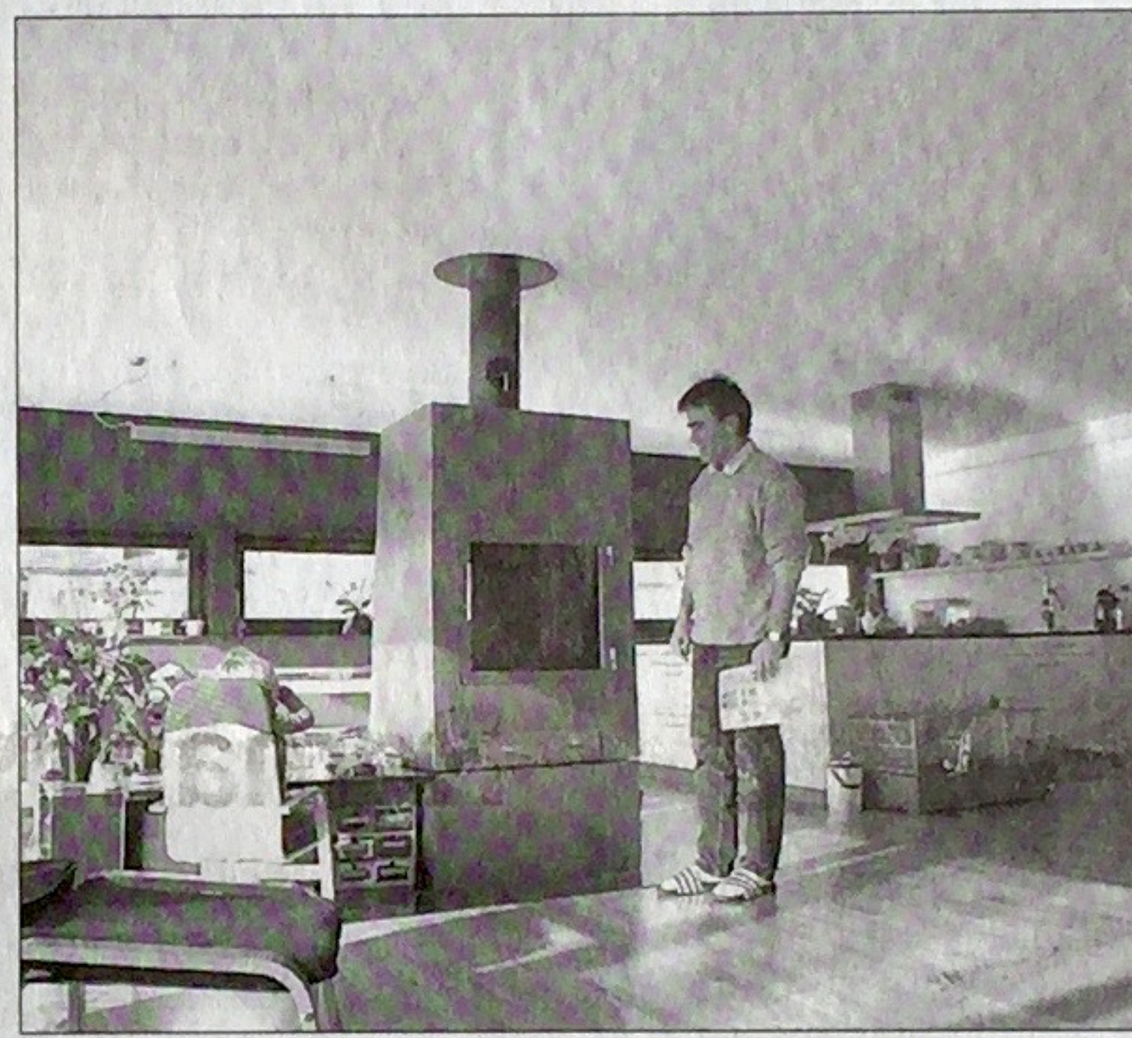
Au premier étage, une vaste pièce abrite le salon et une cuisine ouverte.