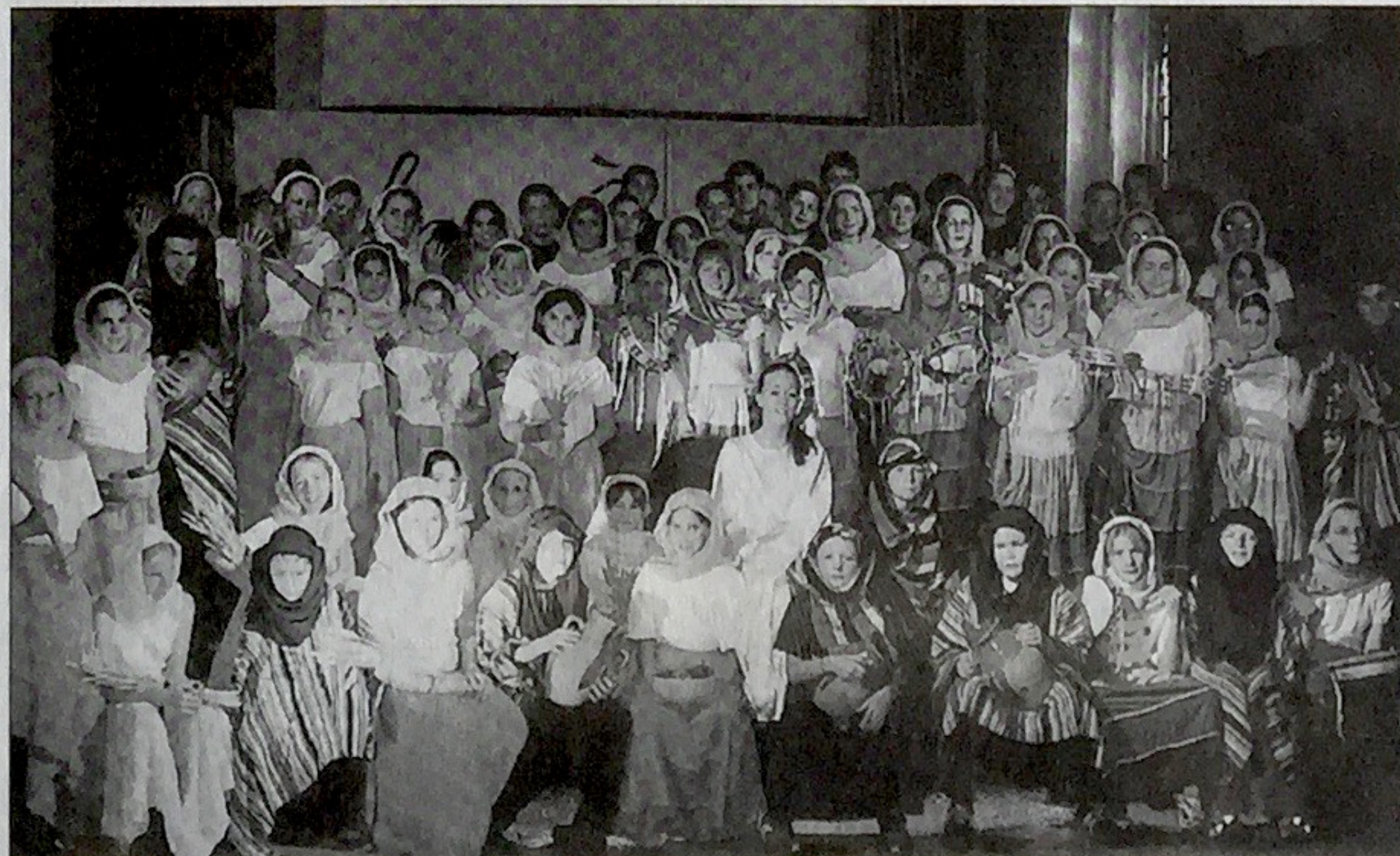
Ces 60 jeunes Normands jouent, dansent et chantent la paix.

donc en spectacle à l'église rouge de Neuchâtel les 12 et 13 février (20h). Avec Jeu de notes, la chorale franc-montagnarde, Varappe animera la messe paroissiale du Noirmont, samedi prochain à 18h30. La chorale sera, enfin, en concert en l'église de Saignelégier dimanche (16h), avant de se produire en l'église du Sacré-Cœur, à La Chaux-de-Fonds, le mardi 17 février (19h30). /MGO